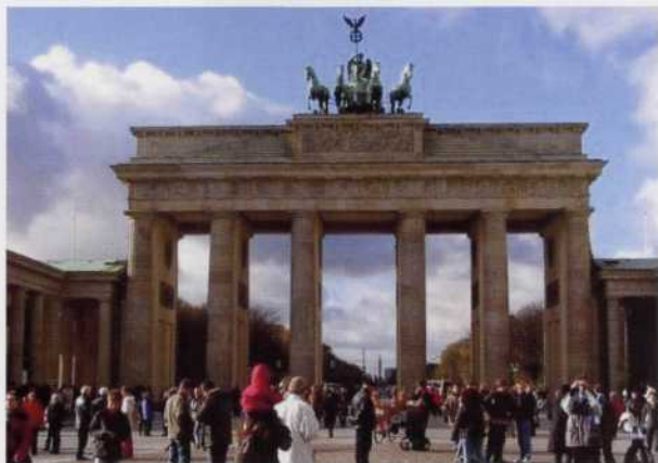
Brandenburger Tor - Berlin